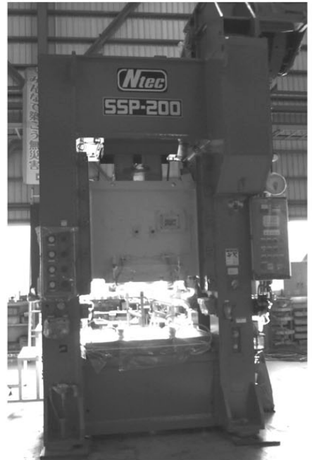
NTEC製 SSP-200SP ▶