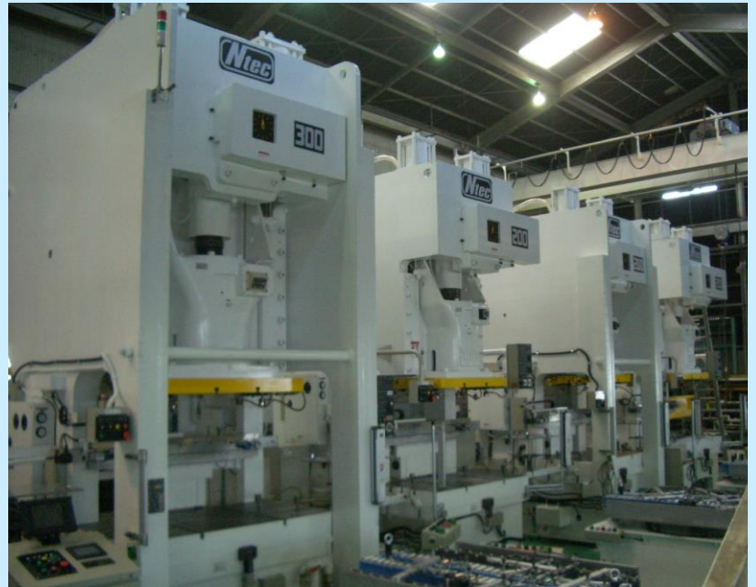
プレス内蔵ロボットライン