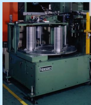
ブランクリフター